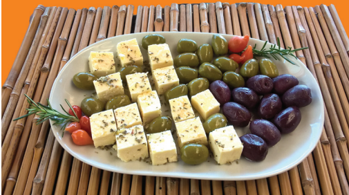
Porção de Buteco R$ 38,00