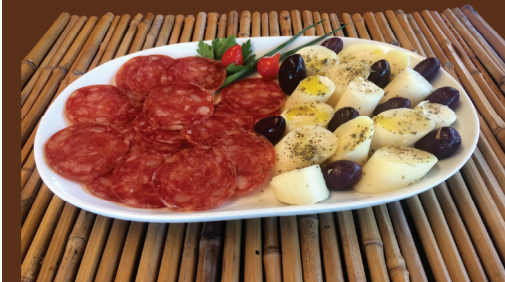
Salaminho diMari R$ 40,00