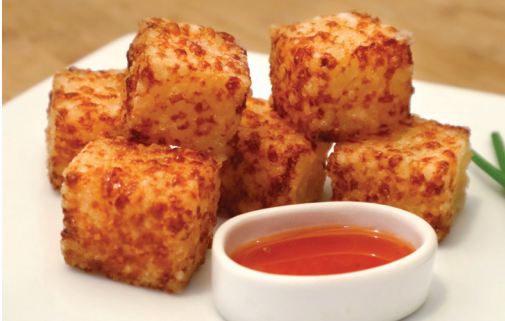
Dadinho de Tapioca R$ 40,00 com geléia de pimenta