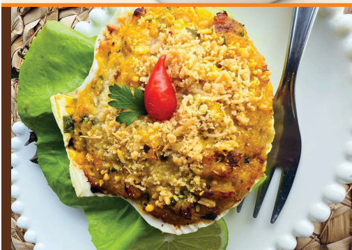
Casquinha de Siri R$ 38,00