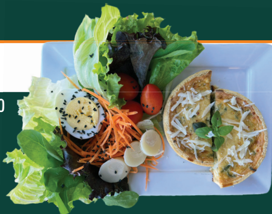
COM SALADINHA R$ 38,00