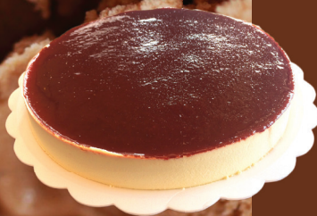
ROMEU E JULIETA